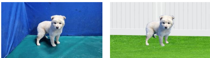
그림 3. 배경 변환 사진 전후 비교 (유기견 1)

총 16쌍의 배경 변환 전/후 사진에 대한 응답을 수집하고, 각각 양자 쌍의 변환 전후 응답 차이를 비교한 결과는 [표 1]과 같다. 유기견 1~8은 실제 입양된 유기견의 사진이고, 유기견 9~16은 입양되지 않아서 안락사된 유기견의 사진이다. 대응 표본 t 검정으로 확인한 결과, 네 쌍의 사진(유기견 1, 3, 9, 14)에서 유의미한 차이가 있음을 확인했다.