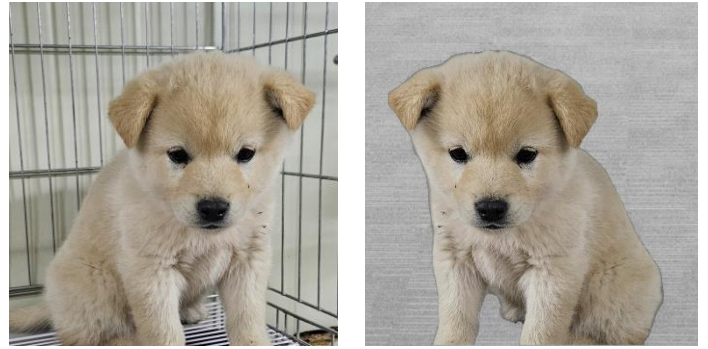
그림 4. 배경 변환 사진 전후 비교 (유기견 4)

어떤 이유로 인해 배경 변환 전후에 유의미한 차이가 발생했는지 또는 발생하지 않았는지 확인하기 위해, 유기견 사진을 검토했다. 원본 사진의 배경이 어둡거나 갸우뚱한 느낌이 드는 사진인 경우, 배경 변환 적용 시 유의미한 차이가 발생했다. 예를 들어, 유기견 1은 원본 사진이 어딘가에 갸우뚱한 사진이지만 배경이 변환된 사진은 상대적으로 밝은 분위기를 주고 있다[그림 3].